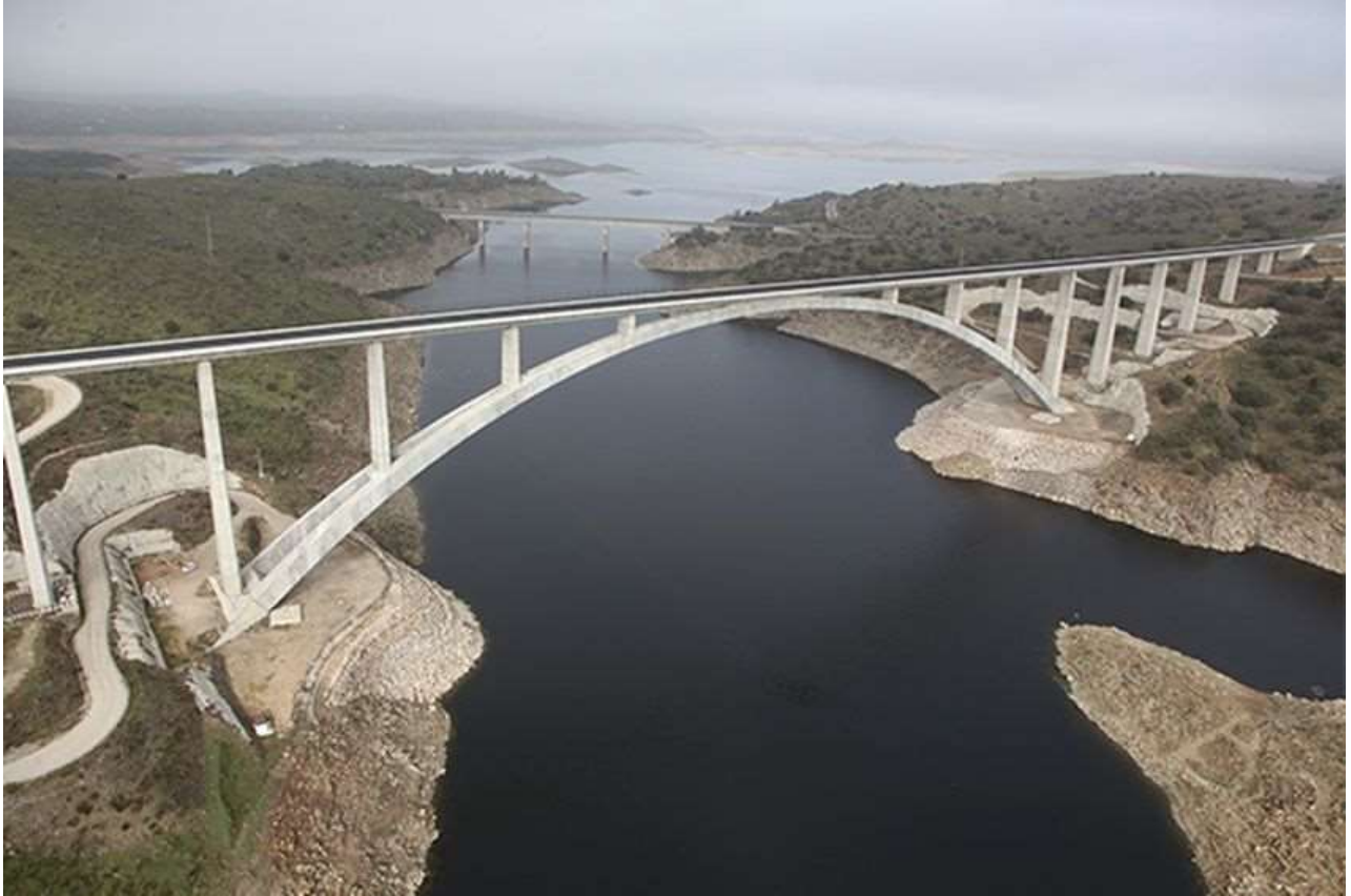
Viaducto Almonte-LAV. Longitud de 996 metros, proyectado con un vano central de tipo arco de hormigón inferior, de 384 metros de luz, récord mundial de luz en su tipología de arco para uso ferroviario de alta velocidad.